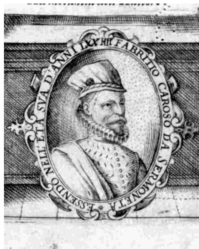
(b) Nobiltà di Dame , 1600 (výřez)