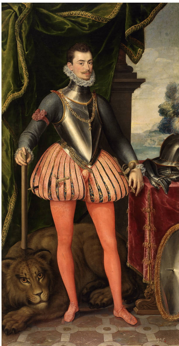
Obrázek 3: Don Juan de Austria (Juan Pantoja de la Cruz)