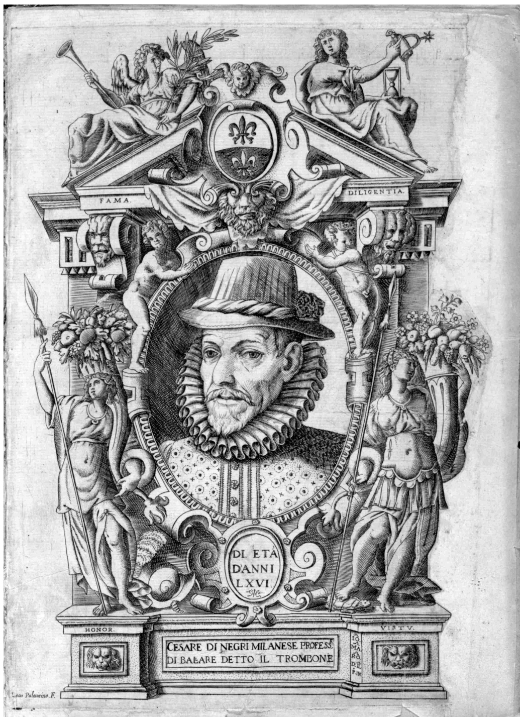
Obrázek 1: Rytina uvedená v obou vydáních Negriho sbírky: Le Gratie d'Amore (1602) a Nuove Inventioni di Balli (1604).