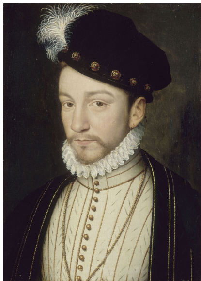
Obrázek 7: Karel IX., svěřenec a mecenáš Pompea Diobona (François Clouet)