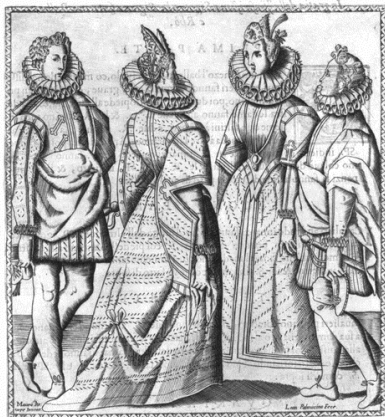
(a) Vyobrazení k tanci Bizzarria d'Amore ( Trattato terzo )

Oproti předcházejícímu století náplň činnosti tanečních mistrů směřuje k větší specializaci závislé na jejich postavení a požadavcích zaměstnavatele či klientely, ve své podstatě se však příliš nemění. I v 16. století kromě tanců vyučovali také společenským způsobům, vytvářeli své vlastní kreace a variace, případně se podíleli se různým způsobem na tvorbě slavností – jako choreografové, režiséři či tanečníci. Vzrůstá podíl těch, kteří své taneční umění zachytili písemně, což zřejmě souvisí i rozvojem knihtisku.