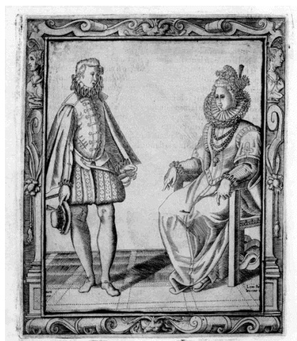
(b) Vyobrazení k pravidlu O provádění poklon ( Trattato secondo – Regola IV )