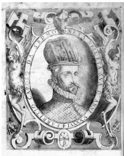
(a) Il Ballarino , 1581