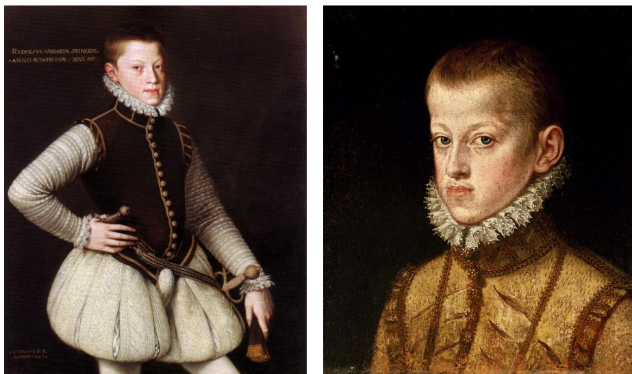
Obrázek 2: Arcivévodové Rudolf a Ernest (Alonso Sánchez Coello)